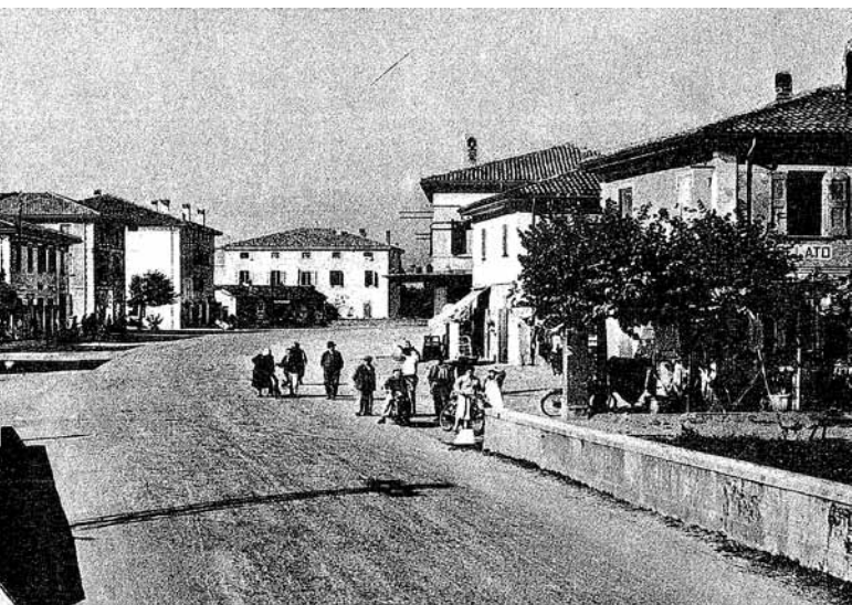
L'oleificio era ospitato nel terzo edificio a destra nella foto.