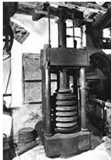
Torchio da olio.