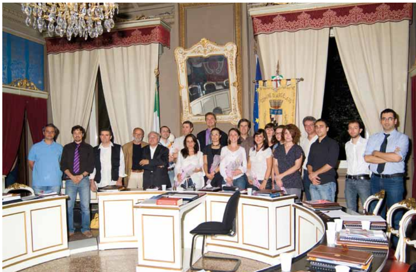
Il Consiglio di Argelato nella fase di insediamento, con la Giunta comunale.