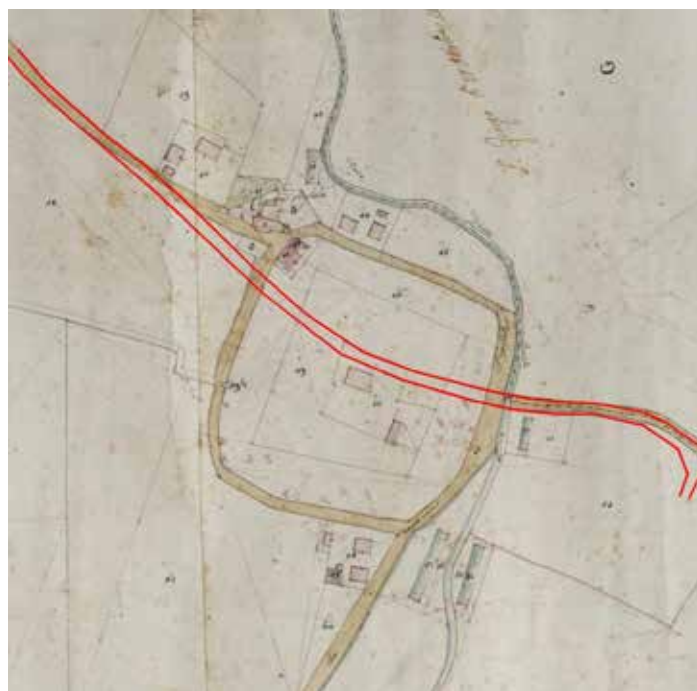
Catasto Gregoriano 1850.