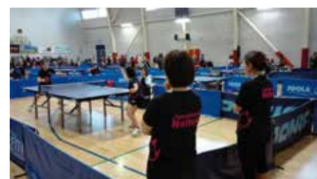
La squadra di serie C femminile