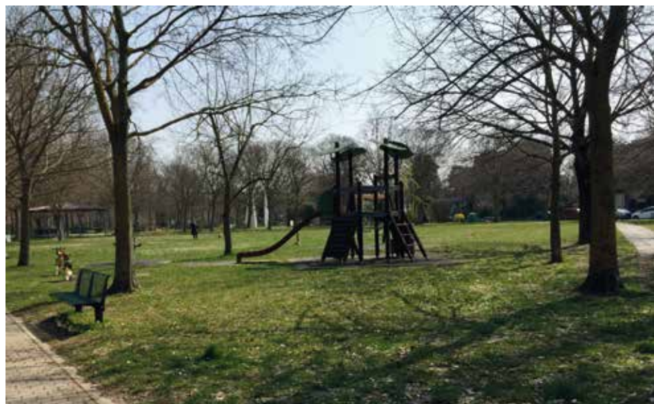
Giardino Parco della Pace. Verrà migliorata l'illuminazione della zona giochi

I lavori sono previsti entro l'estate 2018 con un costo complessivo di euro 69.000.