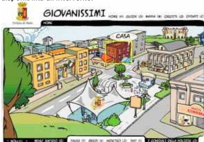
LA CITTA' VIRTUALE DAL SITO DELLA POLIZIA DI STATO