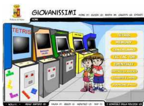
I RISCHI DEL WEB E DEL DIGITALE DAL SITO DELLA POLIZIA DI STATO

Il tema estremamente sentito in questo periodo che coinvolge i genitori dell'era digitale, verteva proprio sui rischi del web, il cyberbullismo, e alcuni consigli per i genitori che si "vedono fare i conti" con una realtà estremamente veloce (sia nella realtà dei social che nella tecnologia) e spesso disorientati.