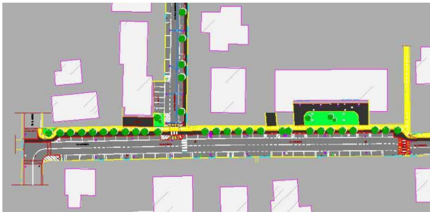
Particolare di Via Matteotti e Via Irma Bandiera. In giallo la pista ciclabile, in marrone il marciapiedi

Nessun albero sarà tolto, anzi ne verranno piantati anche in via Irma Bandiera. In tutta la via Matteotti sarà costruita una pista ciclabile e un marciapiedi, mentre in via Irma Bandiera, per problemi di spazio, sarà costruito solo il marciapiedi. La via sarà illuminata con lampioni a LED. Sarà mantenuto il doppio senso di circolazione e creati parcheggi auto su tutte le due vie. I lavori inizieranno nei prossimi mesi per poter terminare entro l'estate 2018.