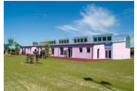
Scuola dell'Infanzia e nido di Argelato

Nel mese di giugno scorso l'Amministrazione Comunale ha provveduto al collegamento in fibra ottica della Scuola dell'Infanzia e del Nido di Argelato. Un risultato importante che consentirà piena funzionalità al plesso e garantirà agli insegnanti ed ai lavoratori della scuola di avere un adeguato supporto alle tante attività in programma.