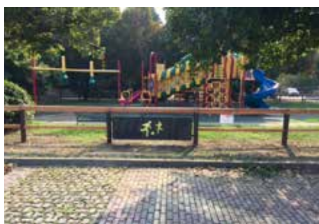
2. Piastra con logo "area gioco" in acciaio "Corten"