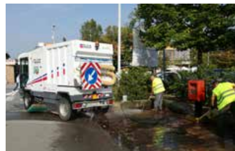
Operatori Geovest puliscono i residui sotto le campane del vetro

Nel mese di settembre abbiamo sostituito le vecchie campane del vetro del nostro territorio e con l'occasione è stata eseguita una pulizia straordinaria delle piazzole a cura di Geovest.