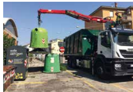
Svuotamento periodico delle campane del vetro