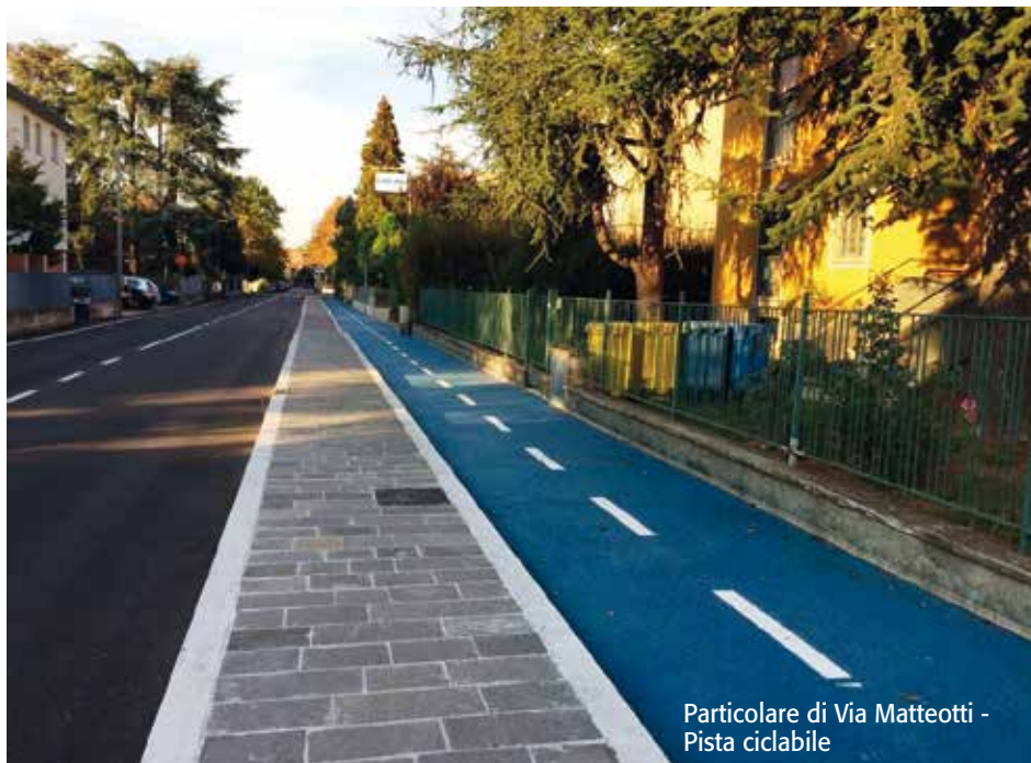
Particolare di Via Matteotti - Pista ciclabile