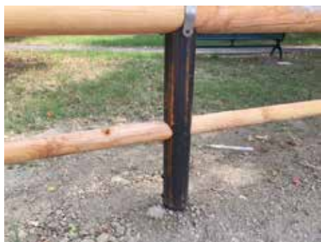
1. Montante verticale in acciaio "Corten"