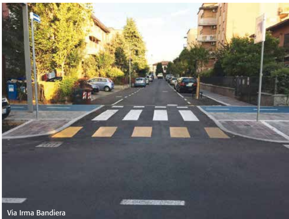
Via Irma Bandiera

Per incapienza di risorse l'intervento di asfaltatura non è stato effettuato sui quattro tratti di Via Gnudi a fondo chiuso, meno danneggiati rispetto al tratto di strada riqualificato. Tali tratti verranno inclusi nella riqualificazione che interesserà Via Amendola.