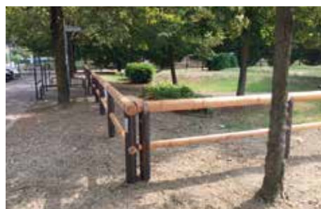
3. Nuova recinzione parco giochi a Funo