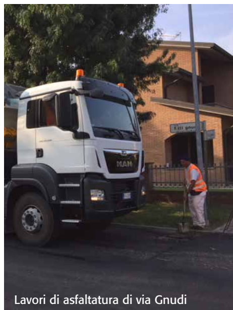
Lavori di asfaltatura di via Gnudi

Lo studio Cupra Group di Bologna, vincitore del concorso, è ora impegnato nella progettazione del primo stralcio di Via Galliera ed una volta ultimata la bozza, la presenteremo alla cittadinanza.