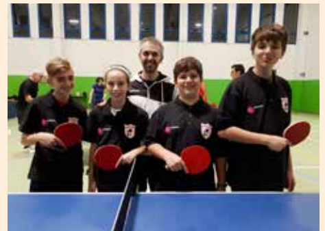
I piccoli neoiscritti alla NettunoTennistavolo