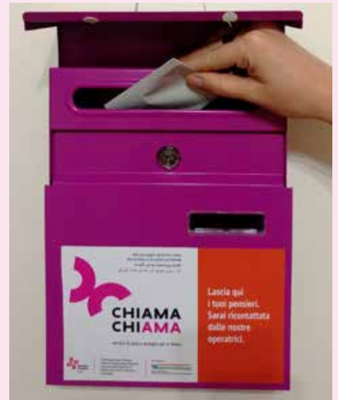
Le cassette viola sono presenti: in Biblioteca ad Argelato, in Municipio ad Argelato, in Biblioteca a Funo, nell'U.R.P. di Funo.

dalle 9.30 alle 17.30 per parlare con l'operatrice del tuo territorio.